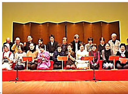
舞台発表は3月に行います。