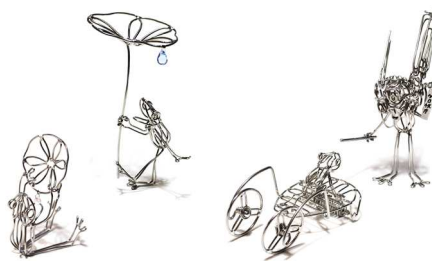
© 2015 Hashi Hironori / チビガエル「しずく」「ごっこあそび」

第6展示室 ワークショップ(有料):8月7日(金)・9日(日)13:00～15:00