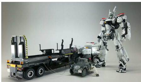
© 2015 HEADGEAR / 「THE NEXT GENERATION -PATLABOR-」 製作委員会