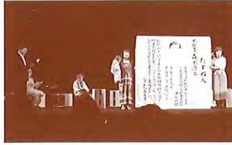
BB★GOLD「カレー屋の女 B級改訂版」 2017年6月4日 ももちパレス(福岡県立ももち文化センター)にて