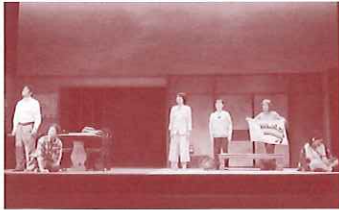
劇団名古屋創立60周年記念公演 第2弾「ありがと」 2017年11月25日 名古屋市港文化小劇場にて