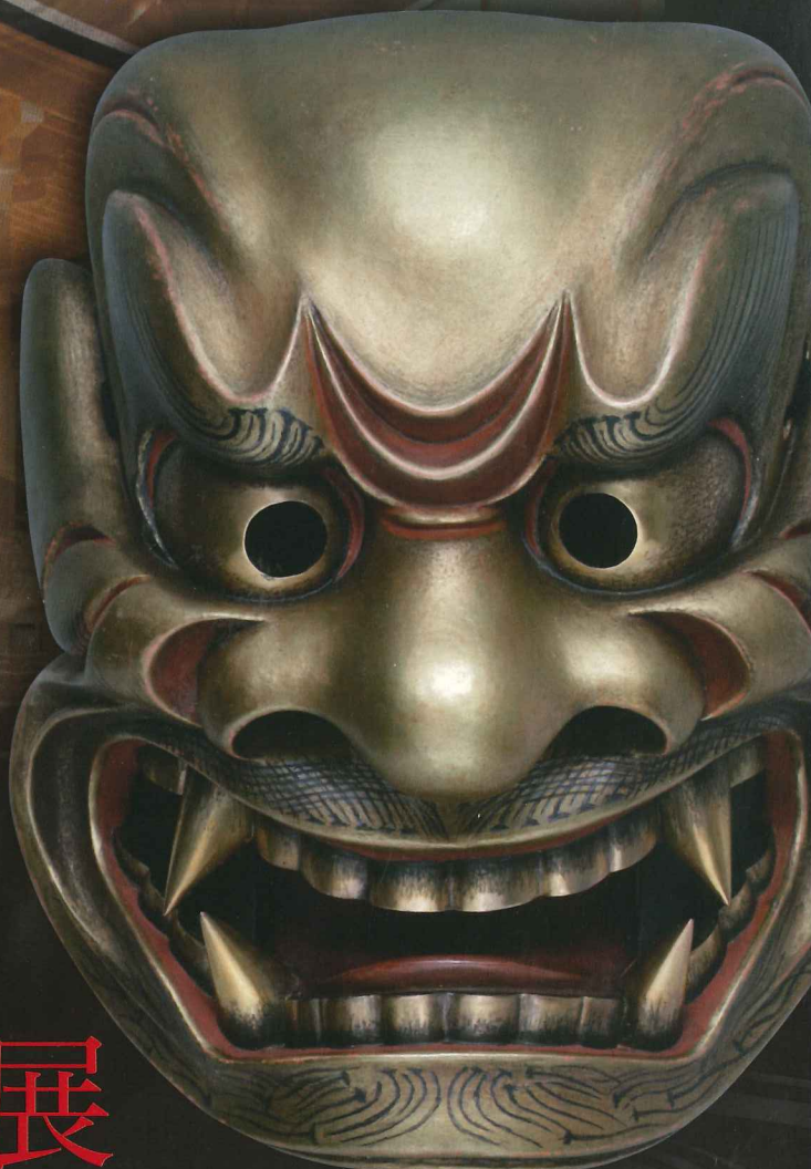
最優秀賞 能楽の里大賞 「獅子口」松尾芳樹(広島県)作