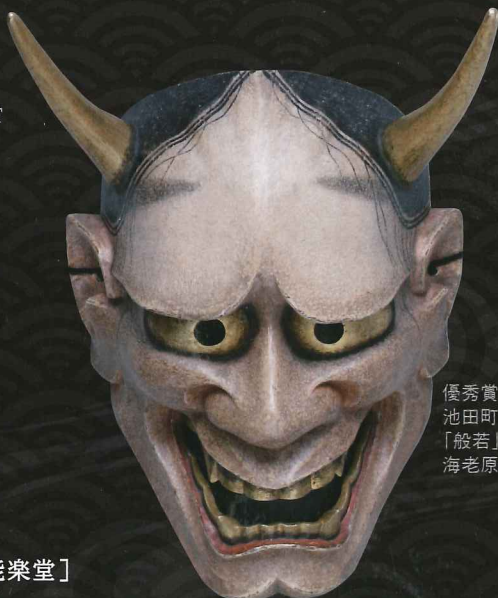
優秀賞 池田町長賞 「般若」 海老原彰(鹿児島県)作