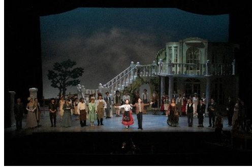
公演の様子② (2022年2月20日)