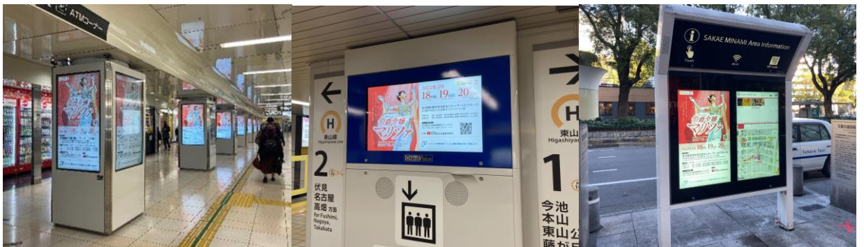
名古屋市営地下鉄等デジタルサイネージ広告