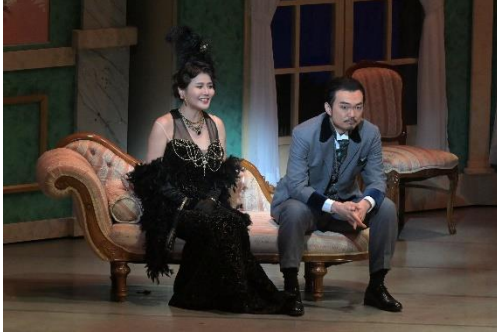
公演の様子① (2022年2月19日)