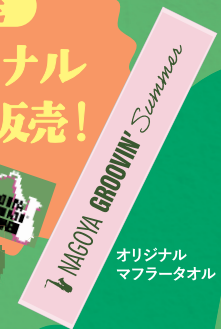
オリジナル マフラータオル