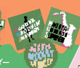
オリジナル ステッカー