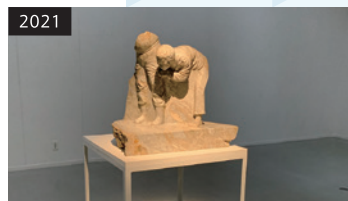
「おばあさんの赤い石」 企画：平田昌輝（第3～4展示室）