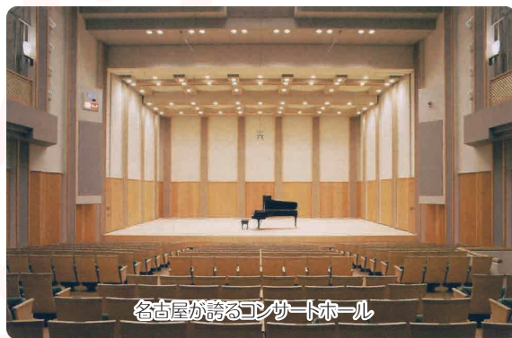
名古屋が誇るコンサートホール

※障がい者手帳をお持ちの方はご本人様と付添 1 名まで割引。 ※未就学児のご入場は保護者同伴の場合でもご遠慮ください。 ※前売で完売の場合には、当日券は販売いたしません。