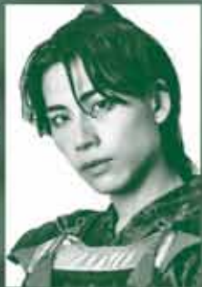
吉原雅斗 (BOYS AND MEN)