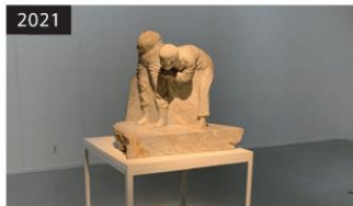
2021 「おばあさんの赤い石」 企画: 平田昌輝 (第3～4展示室)