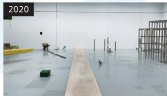
2020 「下手があるので、上手が知れる」 企画: 後藤あこ・山中奈津紀 (第1展示室)