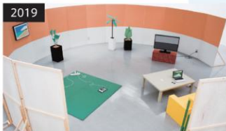
2019 「風景をみる／風景にみる」 企画: 小田川祐希 (第2～3展示室)