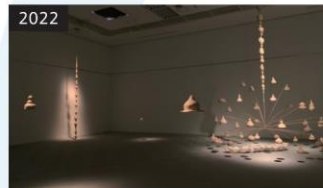
2022 「巻藁船」 企画: 中村綾花 (第1展示室)