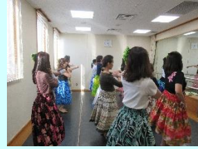
2018年・2019年の様子(練習室にて開催)