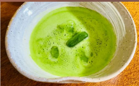
冷やし抹茶と氷菓子のセット (イメージ)