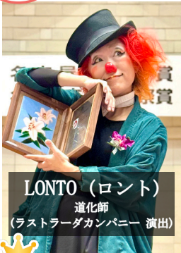
LONTO (ロント) 道化師 (ラストラダカンパニー 演出)

名古屋市が芸術文化振興を図るため、その向上に関して業績が顕著な者に授与する賞です。特に「芸術奨励賞」は、この地域を中心に継続的に活発な芸術創造活動を行い、かつ、将来の活躍が期待され、今後とも本市の芸術文化の振興に寄与することを期待できる個人または団体に送られます。