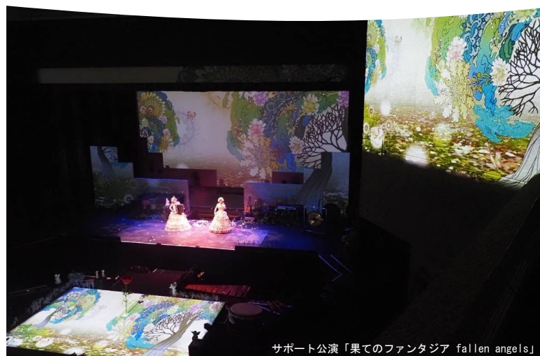
サポート公演「果てのファンタジア fallen angels」