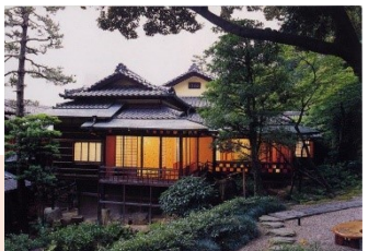
分館 為三郎記念館 為春亭

所在地:名古屋市千種区 池下町 2-50 開館時間:10時~17時 トキメキ通信持参で古川美術館・為三郎記念館共通入館券 200円引