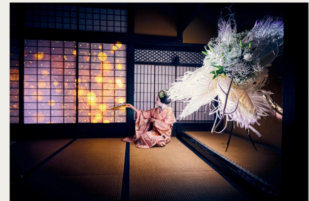
↑↓◎「愛知県指定有形文化財 伊藤家住宅×花とデジタルアートの祭典」(企画：株式会社一旗 2021年)

そして2026年8月23日(日)11時より、北文化小劇場にて、芸どころ名古屋公演「いけばな×音楽 Re:grow」を開催いたします。創流104年を誇るいけばな石田流と、三味線・DJ・ドラムによる迫力の生演奏が交差する、一日限りの特別公演です。花が生み出す美しさと、音楽が呼び覚ます高揚感が重なり合う瞬間を、ぜひ劇場でご体感ください。