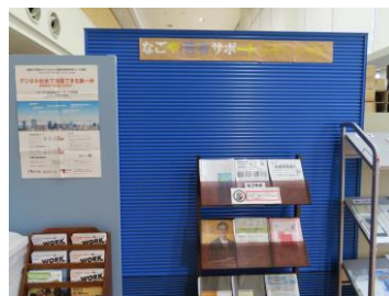
なごや若者サポートステーション ユースクエアの1Fにあります