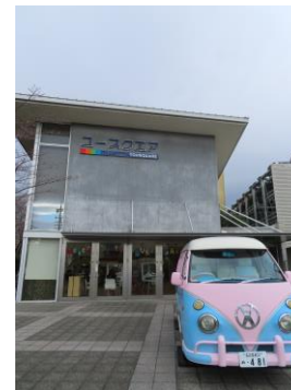
ユースクエア外観