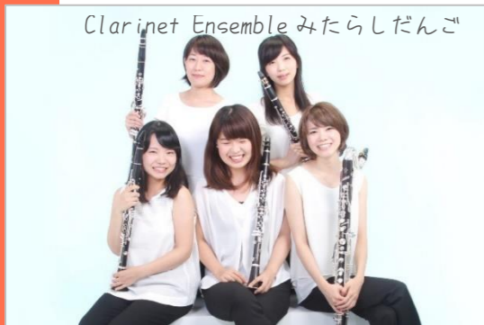
Clarinet Ensemble みたらしだんご

0・1・2才のあかちゃんと、家族みんなにむけた まいて！見て！動ける！クラシックコンサート！ クラリネットのえんそうといっしょに楽しもう！