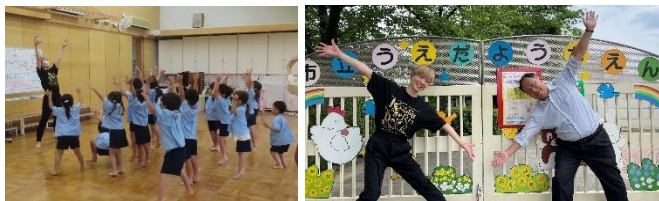
みんなで体を使って表現！