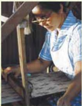
染織「芭蕉布を織る女たち-連帯の手わざ-」

問合せ先: 港文化小劇場 TEL052-654-8214 名古屋市港区港染二丁目10番24号