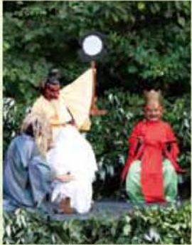
千葉「鬼来迎 鬼と仏が生きる里」

問合せ先: 守山文化小劇場 TEL052-796-1821 名古屋市守山区小幡南一丁目24番10号 アクロス小幡3F