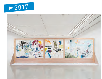
「だれかのなにか」 名知 聡子氏 企画 (第2展示室)