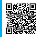
申込フォーム QRコード