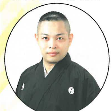
和泉流野村派 当主