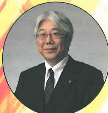
セントラル愛知交響楽団 音楽主幹