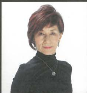
構成・演出・振付 名鶴 ひとみ

宝塚歌劇団出身。月組において娘役、主に歌手として活躍。研一生の時に準主役に抜擢、新人賞を受賞。