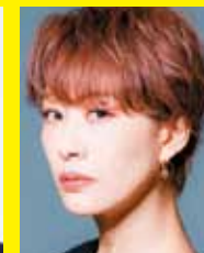
朴 璐美 (土屋百合)