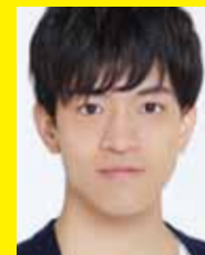
石川界人 (風見涼太)