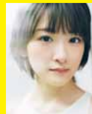
生駒里奈 (森山みくり)