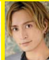
矢田悠祐 (風見涼太)