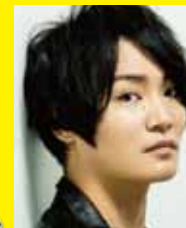
細谷佳正 (津崎平匡)