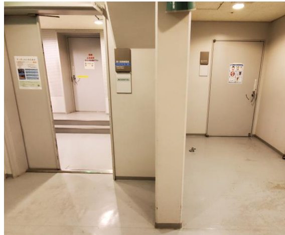
スタジオ出入口と控室出入口