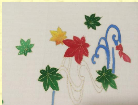
下絵の描いているハンカチに色をのせて友禅体験