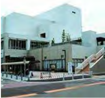
名古屋市北文化小劇場 Nagoya City Kita Playhouse