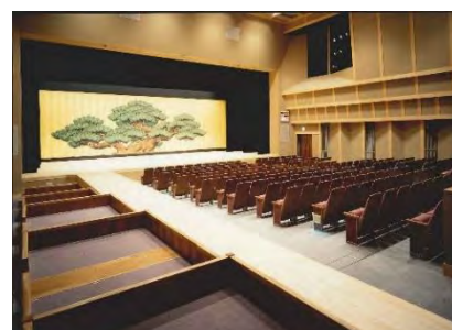
北文化小劇場ホール

公園隣の静かな環境の中にあり、木目と白を基調とした柔らかな和の雰囲気を持つ劇場です。劇場の特徴を活かした伝統芸能の公演や地元名古屋で活躍する様々なジャンルのアーティストが出演するコンサート等、文化芸術公演の企画運営も行っております。人と人を、人とまちをつないでいく文化芸術のコーディネーターや、まちの魅力を高めていける劇場を目指しています。