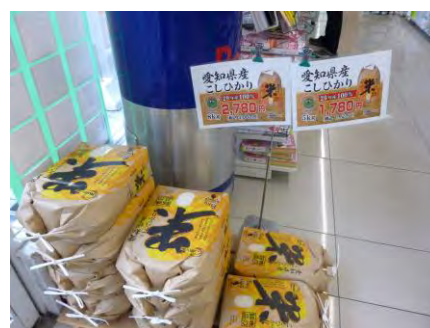
愛知県産こしひかり