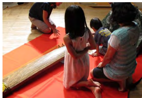
楽箏を体験している様子

主な演奏法には、小爪(こづめ)、閑搔(しずがき)、早搔(はやがき)、連(れん)、結ぶ手などがあります。