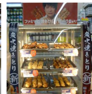
ファミマの焼きとり

〒462-0026 北区萩野通1-46-3 TEL 052-910-3032 24時間営業 無休 北文化小劇場より 徒歩3分