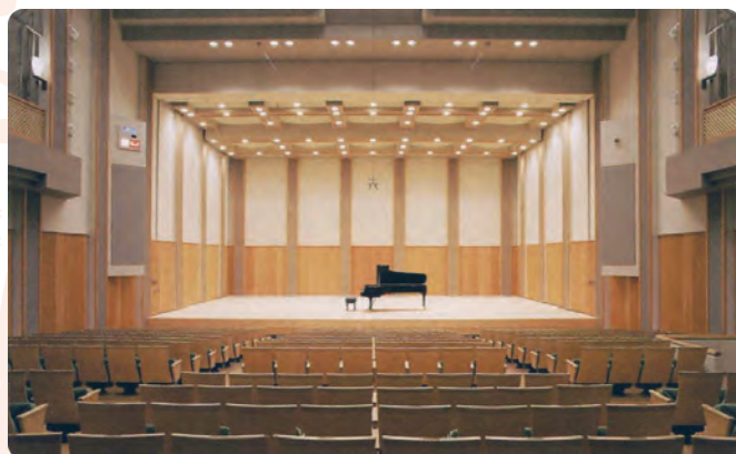
名古屋が誇るコンサートホール・352席のプレミアムシート