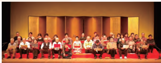
今年の舞台発表の様子