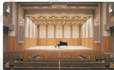
名古屋が誇るコンサートホール (352席)

※障がい者手帳等をお持ちの方は ご本人様と付添1名まで割引。 ※未就学児のご入場は保護者同伴 場合でもご遠慮ください。 ※前売で完売の場合には、 当日券は販売いたしません。