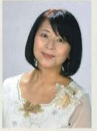
白樺八青 Yao Shirakaba (声)

ミュージカル俳優、歌手、司会者、テレビラジオのパーソナリティーなどを経て、言葉の伝えびと・ボイスパーフォーマーとして独自の世界観を確立。人々の声と言葉を磨き自己を開花させる「ことばのまなびや」主宰。