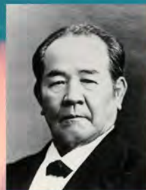
渋沢栄一