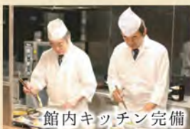
館内キッチン完備

お客様からの葬儀等へのご不安を解消する個別お葬式相談を無料で承ります。お気軽にお問い合わせください。