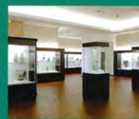
横山美術館 展示室

入 館 料 ▶ 一般 1,000円 / 65歳以上・高・大学生 800円 / 中学生 600円 / 小学生以下無料