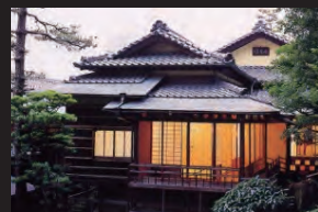
分館 爲三郎記念館 外観