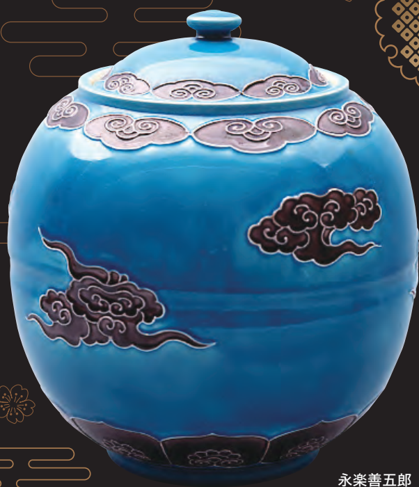
永楽善五郎 「浅黄交趾雲絵水指」