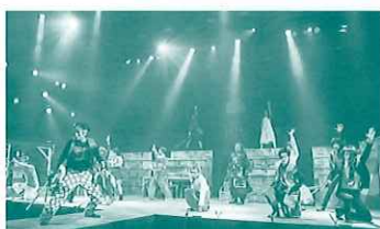
演劇組織KIMYO 第17回公演 「ドラザムライ」 2017年11月2日(木)~5日(日) 愛知県芸術劇場小ホールにて