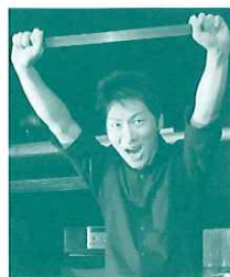
第4回名古屋演劇杯 参加作品 「レールステージ2017」 2017年9月30日 G/PITにて