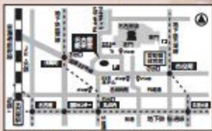
※地下鉄・市バス等公共交通機関をご利用ください。